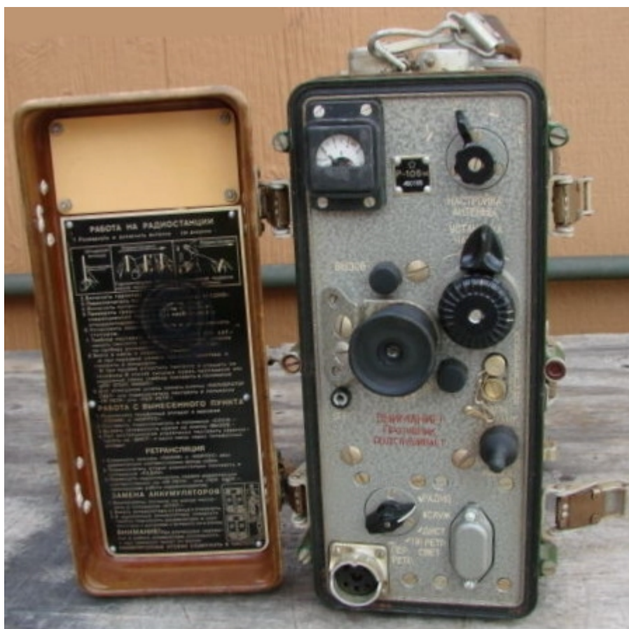
R-108M katonai adóvevő 28-36,5 MHz, 1 W out

Nem sokkal az Esztergomban ideiglenesen állomásozó orosz csapatok kivonulása után megkeresett egy fiatalember azzal az ajánlattal, hogy lenne egy, az oroszok által itt felejtett működőképes rádió, amit ingyen nekem adna. Oké, nézzük meg! Felkerestük a rádió lakóhelyét egy sötét pince mélyén, ahol az a kellemes meglepetés ért, hogy a közismert R-105D adóvevő modernizált kistestvérevel, az immáron hibrid felépítésű R-108M-mel találtam szembe magam. Ezt onnan tudtam meg, hogy rá volt írva a szép, csau színű bakelitruhába öltöztetett rádió adattáblájára. További kellemes meglepetés ért azzal, hogy a készülék a bekapcsolást követően látszólag azonnal életre kelt és ami a legfontosabb – a fotóskála 28.000 kHz-cel kezdődött. A rádióhoz járt még egy Kulikov antenna és egy fejhallgatós kézibeszélő készlet.